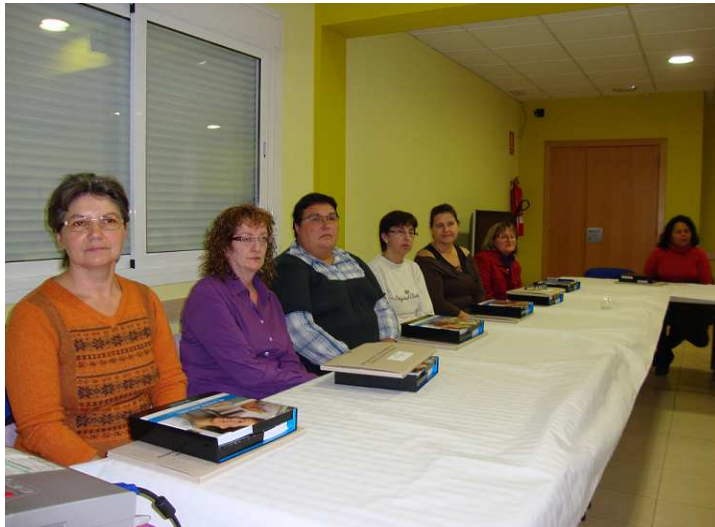
Foto 4- moment de la inauguració del curs en tècniques de cura i autocura per a cuidadores de persones dependents.