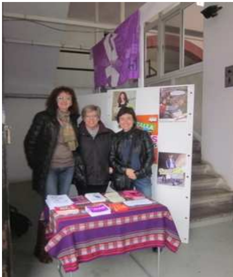
Foto 9- Parada contra la violència masclista; Mercat Municipal d'Amposta; 22 de novembre.