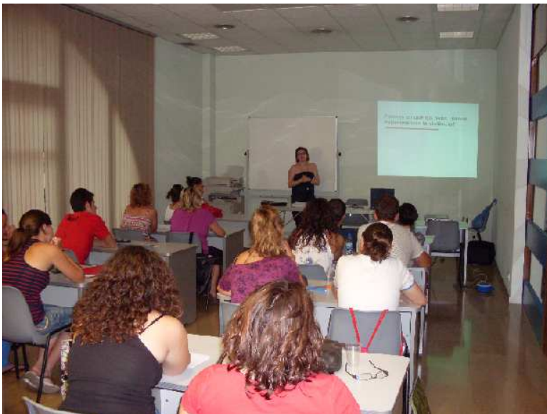
Foto 1. Moment dels monogràfics de prevenció de violència masclista duta a terme als Cursos de monitoratge en el lleure a la comarca del Montsià.