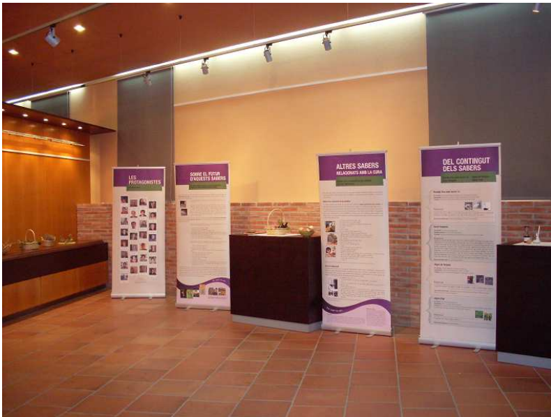
Foto 11.- Exposició "Els sabers de les dones del Montsià: els sabers relacionats amb la cura de la salut" al Museu de la Terrissa de La Galera; setembre de 2011.

Està previst que l'exposició continuï itinerant per al resta de municipis de la comarca al llarg del 2012.