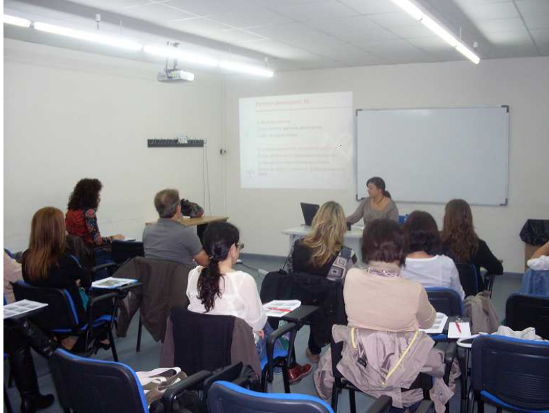
Foto 2. Moment de la formació en llenguatge no sexista ni androcèntric dut a terme al personal de l'Ajuntament d'Amposta els dies 18 i 21 d'octubre de 2011.