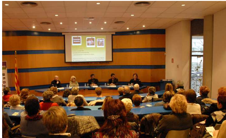
Foto 8- Moment de la celebració del Dia Internacional de les Dones a la seu del Consell Comarcal del Montsià; Amposta 4 de març de 2011.

Pel que fa a la celebració del Dia 25 de novembre, Dia Internacional contra la violència en vers les dones , aquest any hem participat en una sèrie d'actes que hem anomenat "Setmana contra la violència masclista" i que han estat organitzats en col·laboració amb el Pla Local de polítiques de dones de l'ajuntament d'Amposta i el Centre d'Intervenció Especialitzada de les Terres de l'Ebre.