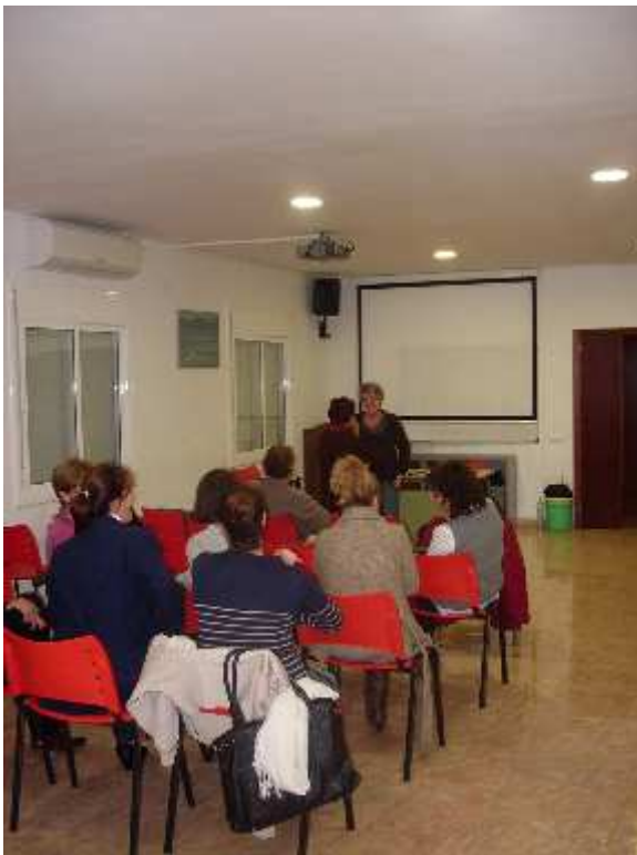
Foto 3- Moment d'una xerrada de la psicòloga del SIAD realitzada a Sant Jaume d'Enveja el 25 de novembre de 2011.