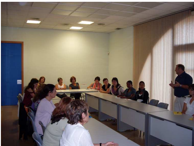
Foto 4- Moment de la jornada de sensibilització en autoocupació.

Aquesta formació es va dur a terme en col·laboració entre l'orientadora laboral del SIAD i el tècnic de la Xarxa Inicia del Consell Comarcal del Montsià. Consistí en una formació en sensibilització en matèria d'autoocupació que va tenir lloc el dijous 22 de setembre de les 9,30 a les 11,30 a la seu del Consell Comarcal del Montsià i de la qual hi van participar al voltant de 20 dones.