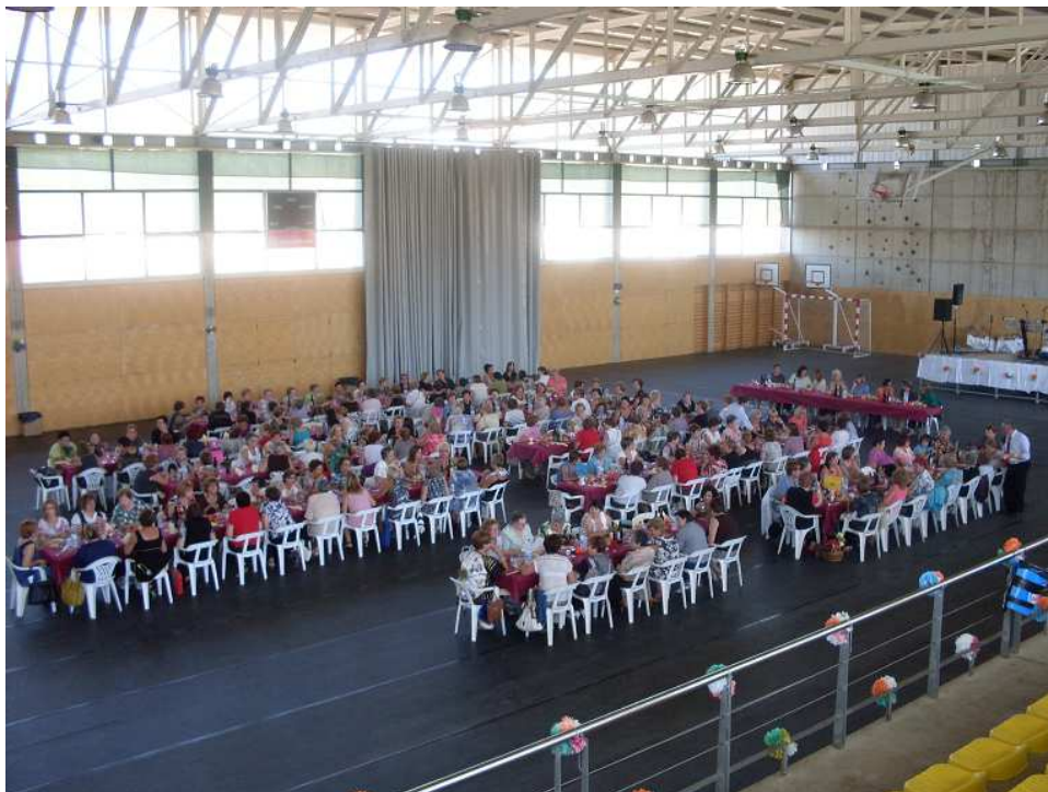
Foto 7- Trobada d'associacions de Dones del Montsià; La Sénia 6 d'octubre de 2011

- Suport en l'organització de la Trobada de dones del Montsià anual: aquest any hem ofert suport a l'associació de mestresses de casa de La Sénia dones Senienques en l'organització de la XX Trobada de Dones del Montsià.